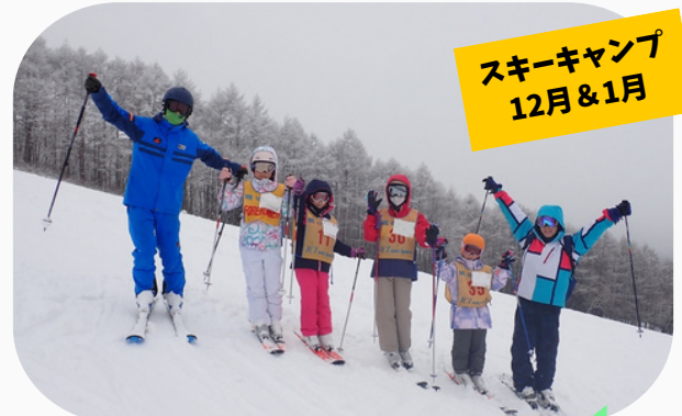
スキーキャンプ 12月&1月

事前にカウンセラーのスキー研修があります。 レンタルスキーもあるので安心してキャンプに 参加できる！ ウェアがあれば大丈夫